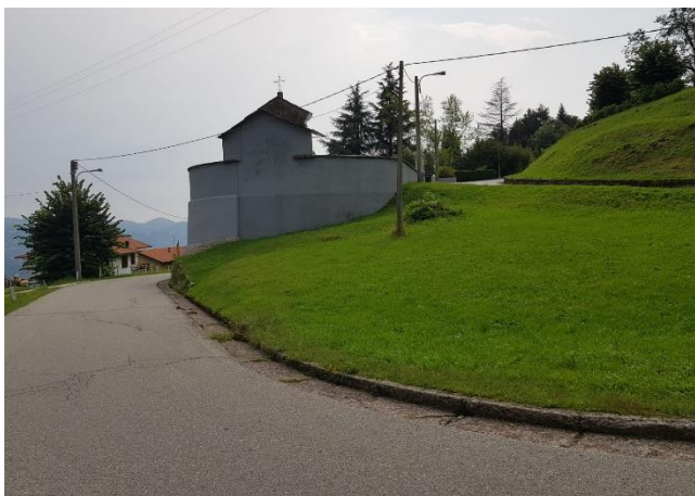
Vista prospetto Nord (F - 1)