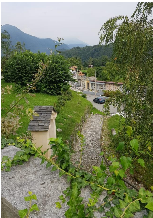
Vista del percorso pedonale di collegamento alla Chiesa (F - 13)