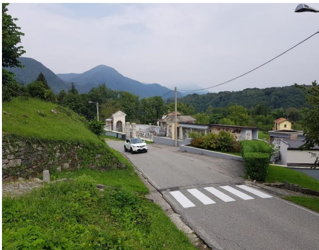
Vista dell'attraversamento pedonale zebrato (F - 11)