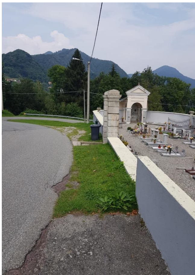
Vista della zona di intestazione del nuovo parapetto (F - 14)