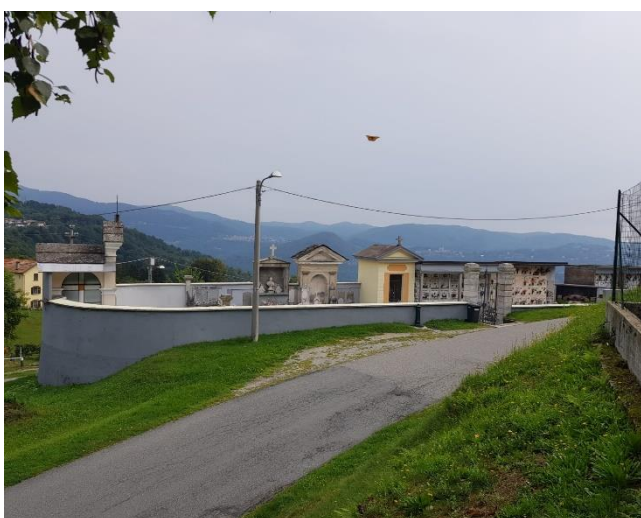
Vista aree di intervento dalla "riva di monte" (F - 7)