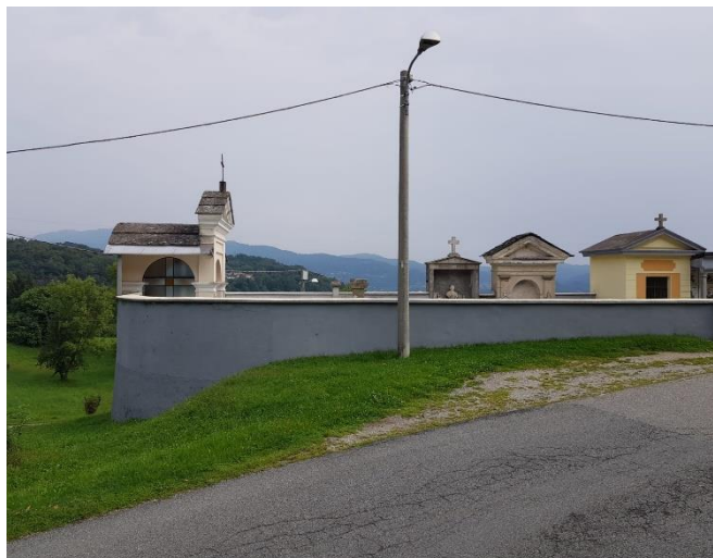
Vista prospetto nord-ovest (F - 6)