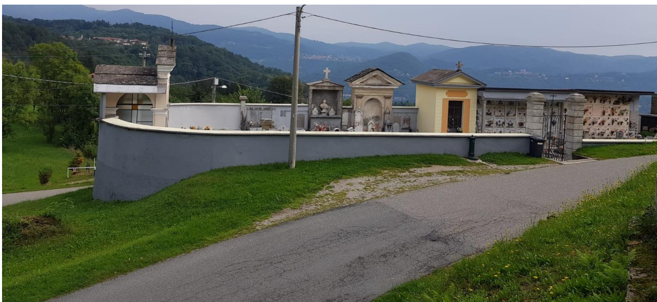
Vista grandangolare zona di intervento (F - 4)