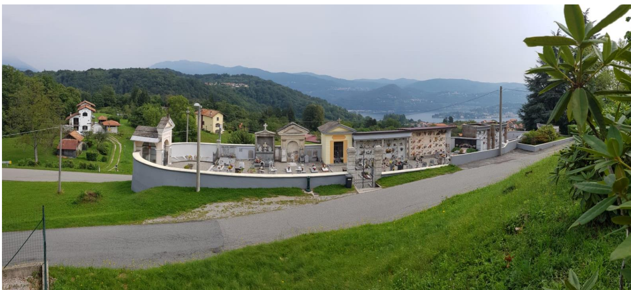
Vista zona accesso e di futuro intervento (F - 3)