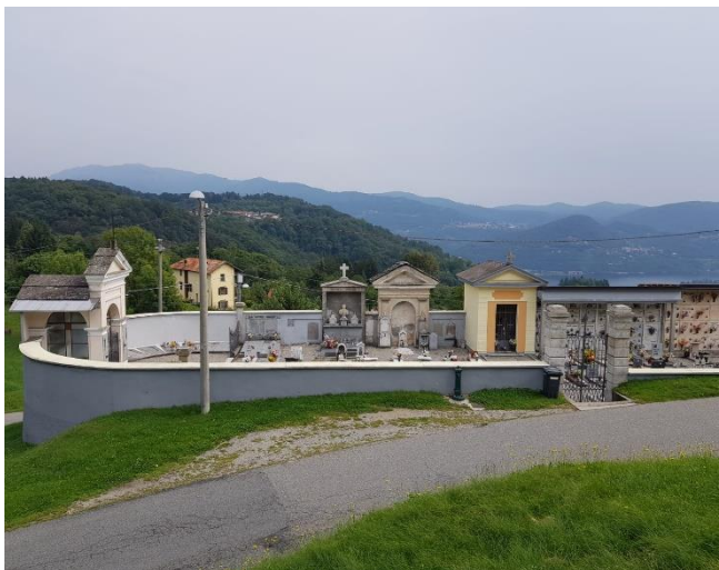
Vista della viabilità stradale (F - 5)