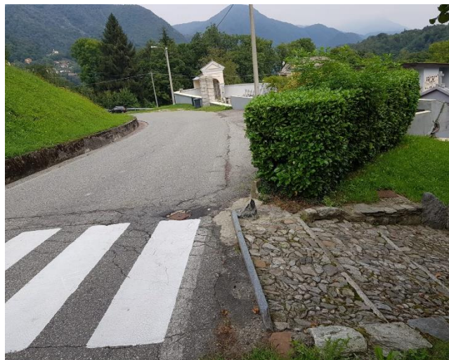
Vista del percorso pedonale a monte del cimitero (F - 12)