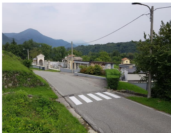
Vista della viabilità stradale sovrastante (F - 10)