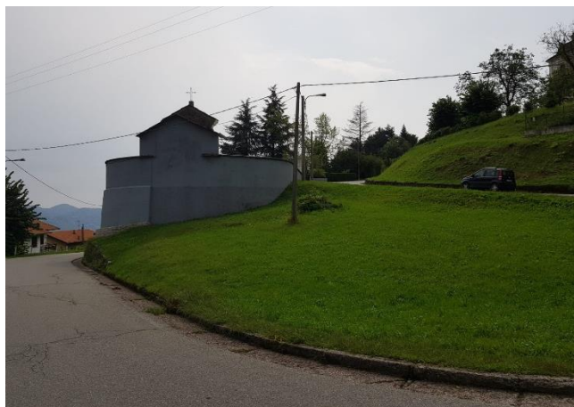
Vista prospetto Nord (F - 2)