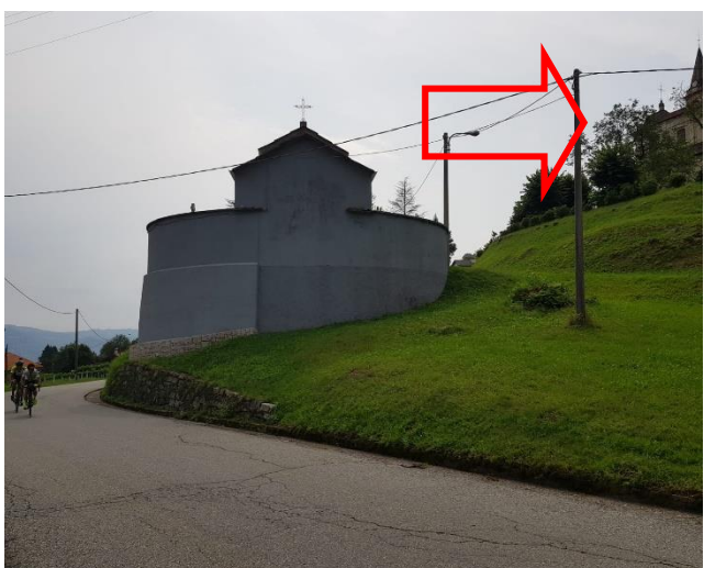
Vista della chiesa dalla viabilità sottostante (F - 9)