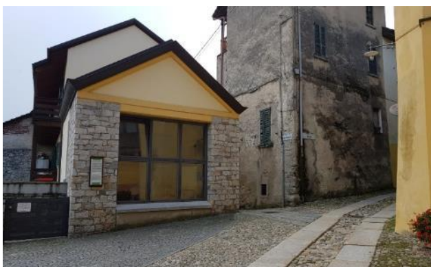
Vista della facciata afferente la zona d'intervento (F - 8)