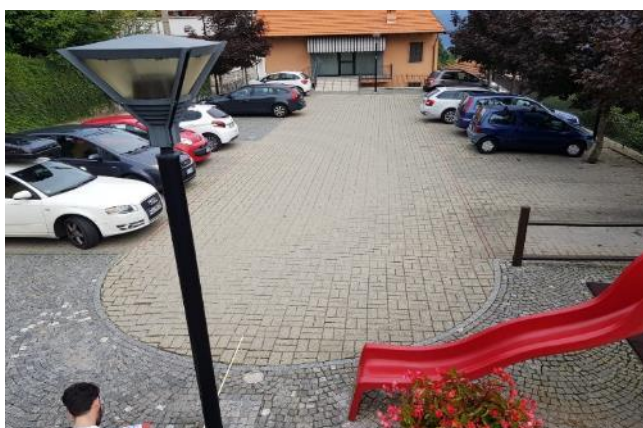
Vista area di parcheggio adiacente al Museo (F - 1)