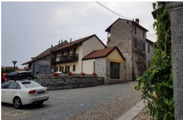
Vista del Museo dalla Via Frua (F - 11)