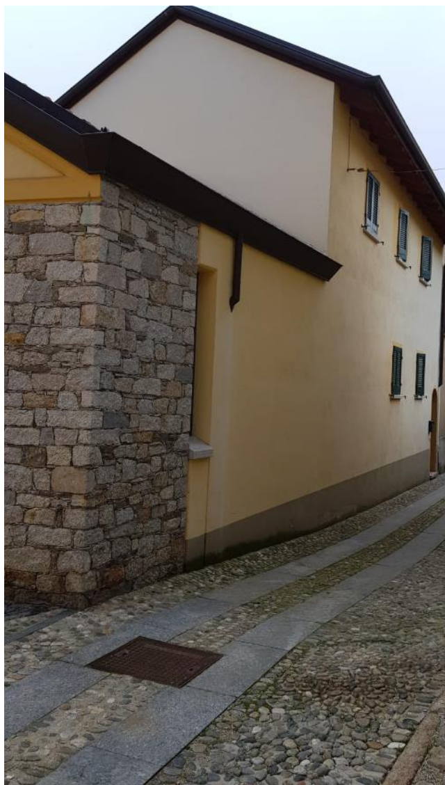
Vista dell'incrocio tra Via Frua e Via Vallenasca (F - 6)