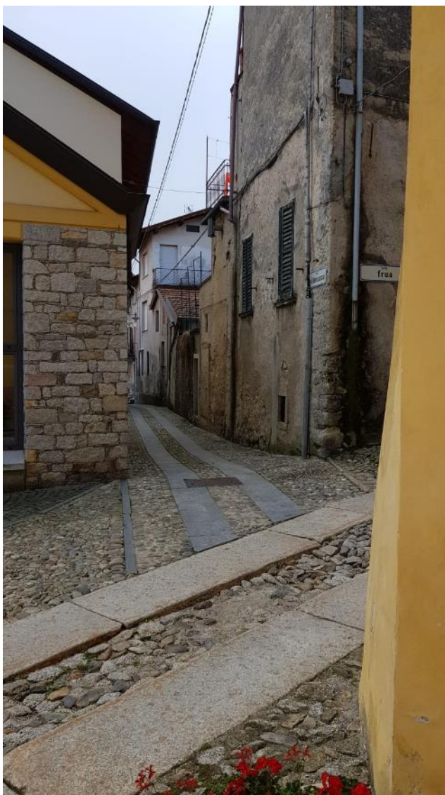
Vista della via Vallenasca (F - 5)