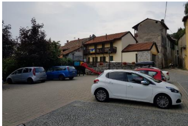
Vista del Museo dalla zona di parcheggio (F - 12)