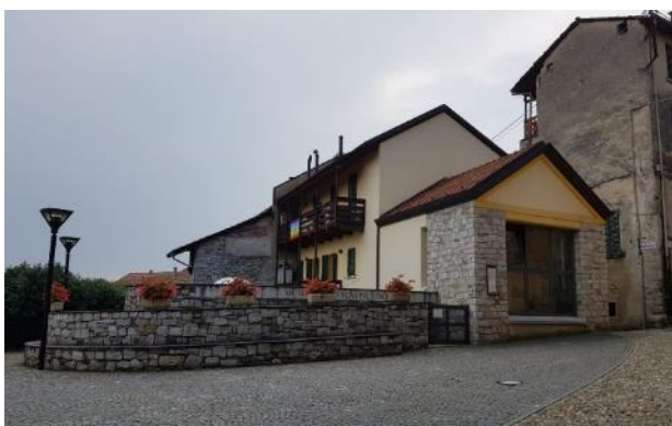
Vista della aree esterne al museo e dell'ingresso (F - 7)