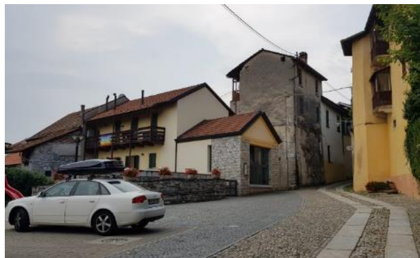
Vista della diverse pavimentazioni esterne (F - 10)