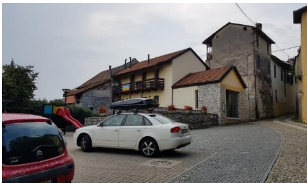
Vista del "marciapiede" in cubetti di serizzo (F - 9)