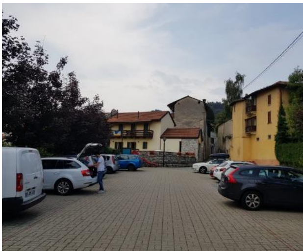
Vista dalle Piazza Europa pavimentata in auto bloccanti (F - 13)