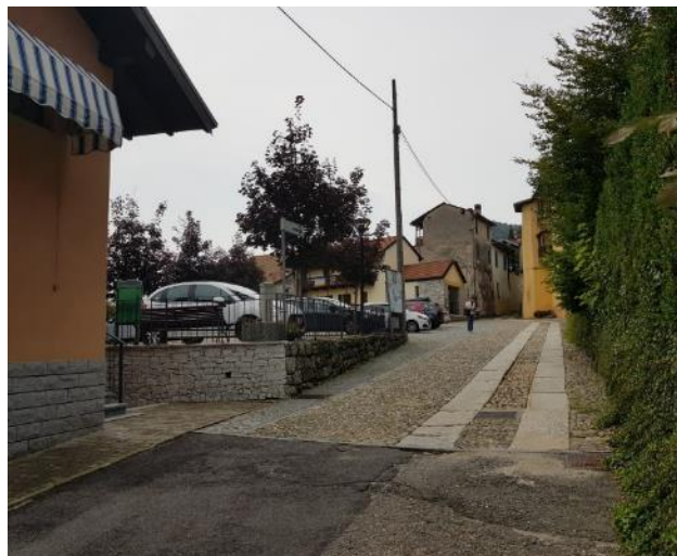
Vista del Museo dalla testata in asfalto di Via Frua (F - 14)