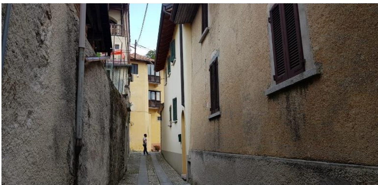
Vista da Via Vallenzasca del Museo (F - 3)