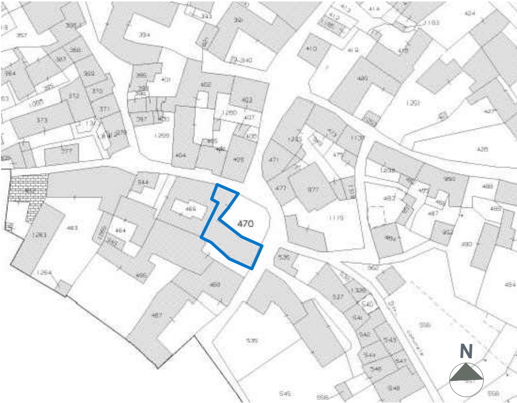
ESTRATTO CATASTALE scala 1:1000 Foglio 3 Mappale 470 sub. 1