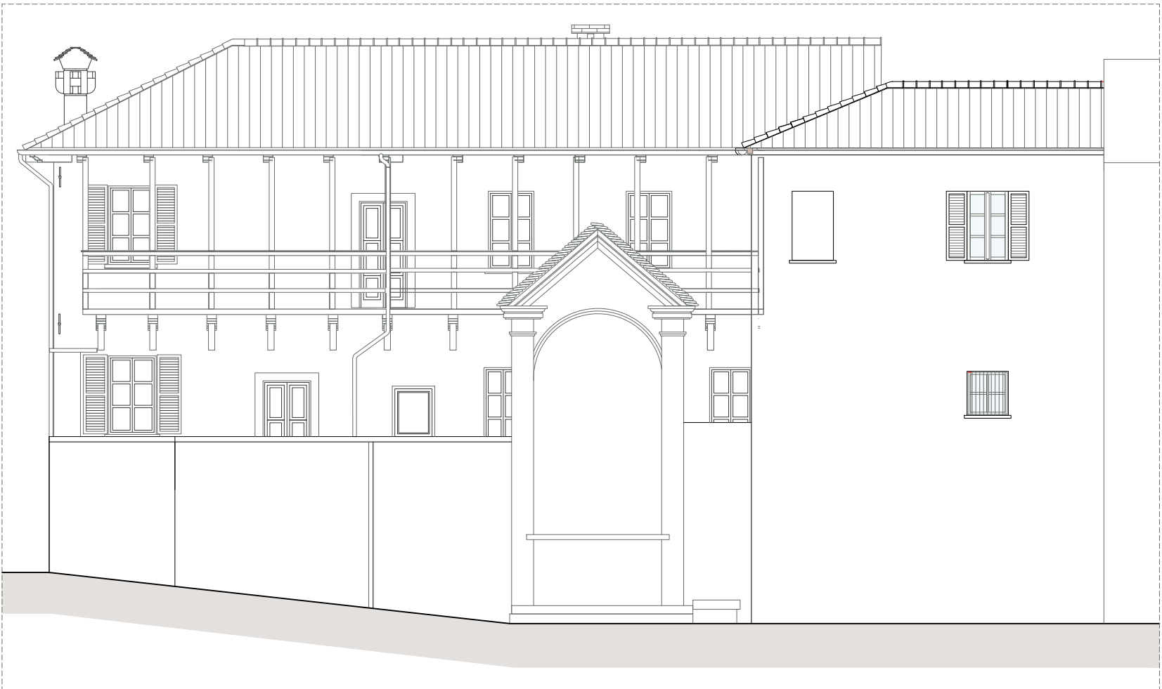
PROSPETTO NORD su Vicolo Scarione - SEZIONE D-D scala 1:100