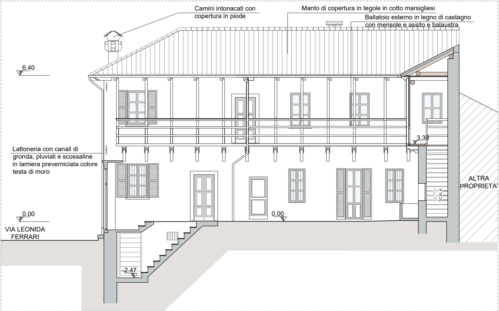
PROSPETTO NORD su Corte Interna SEZIONE C-C scala 1:100