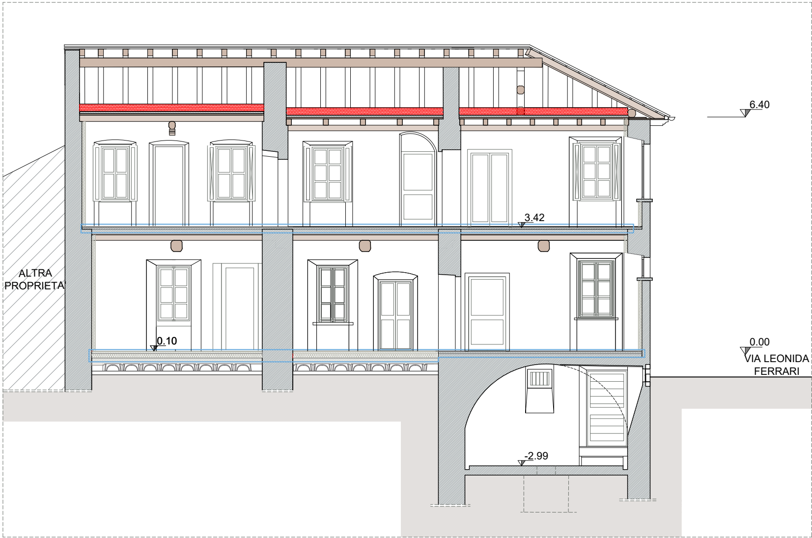
SEZIONE B-B scala 1:100